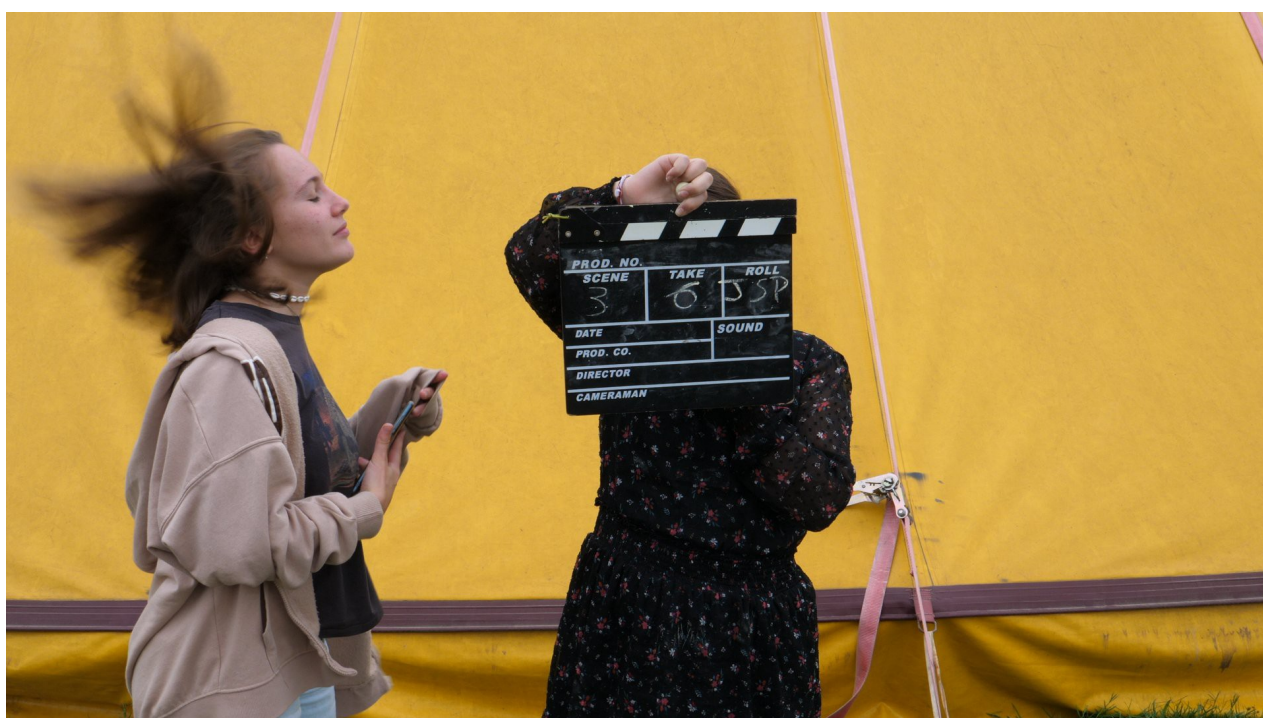
Court-métrage TikTok TokSik réalisé en octobre 2022 avec l'association Les Arts à Souhait