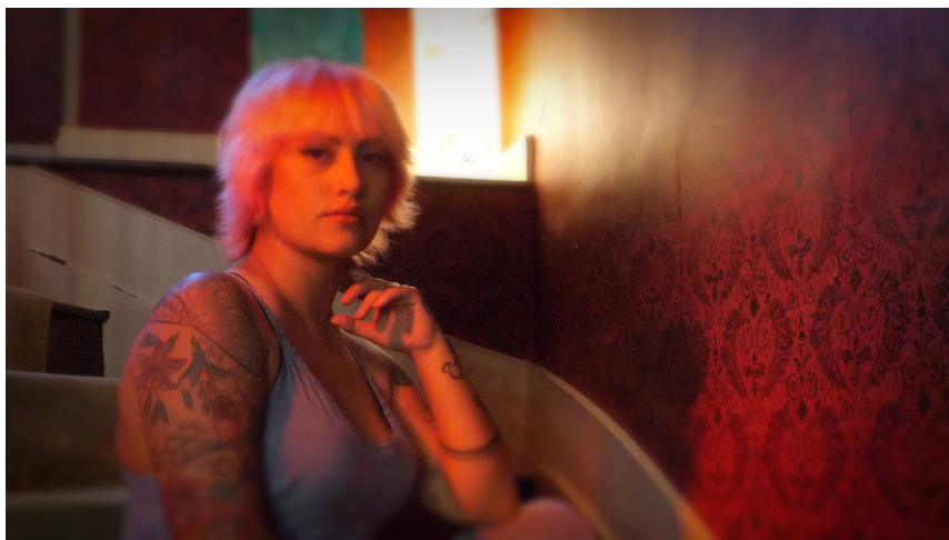
Clip Macha Chansons Françaises

Fiche « Jad, les Jasses » : https://www.film-documentaire.fr/4D ACTION/w_fiche_film/39572