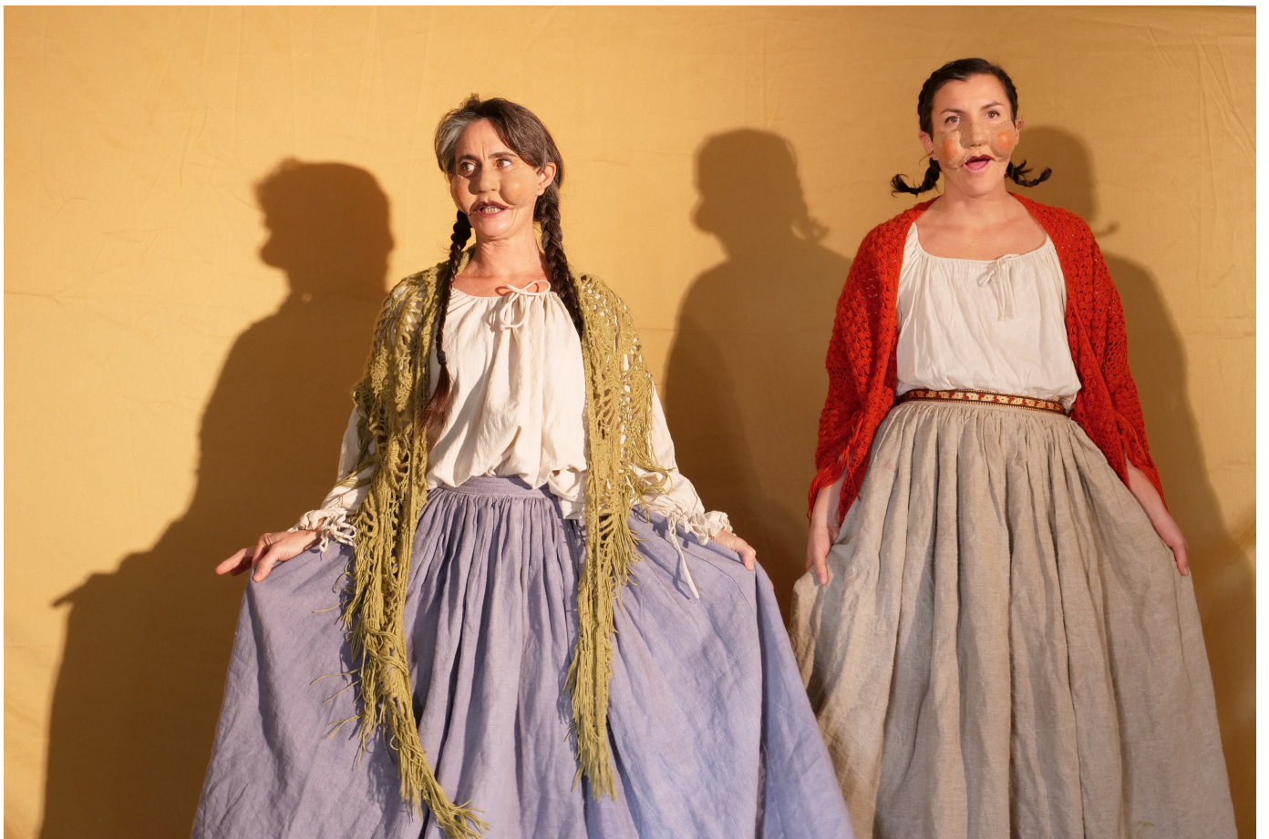
Teaser du spectacle l'origine des contes (Cies Alix O Pays des Merveilles et Plume de l'Arbre) en 2022