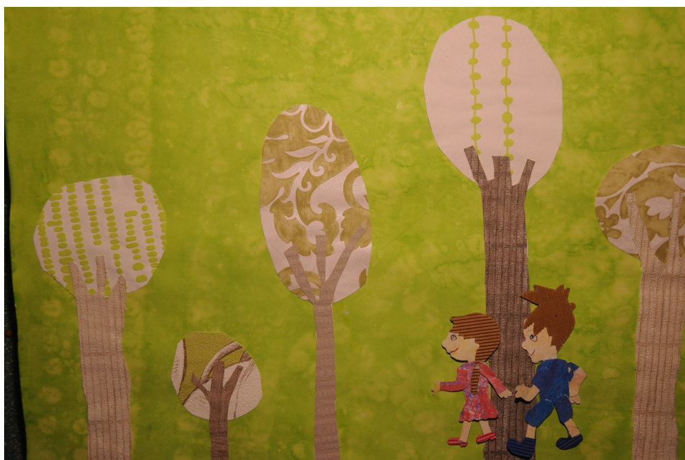
Film d'animation Hansel et Gretel réalisé avec la classe de CP de l'école de Creysse en avril 2022