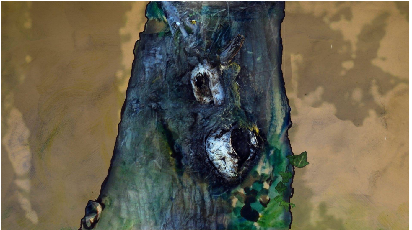
Séquences animées pour le Pinocchio du Théâtre de la Gargouille (Bergerac)