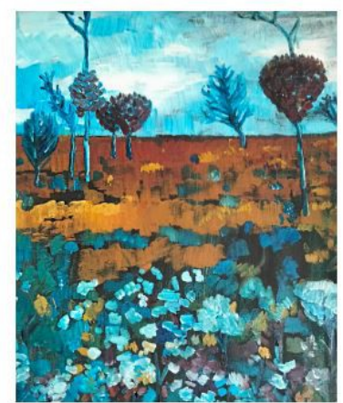
PAGE GAUCHE HAUT : Dessin du matin, gouache sur papier, 29,7 x 21 cm.