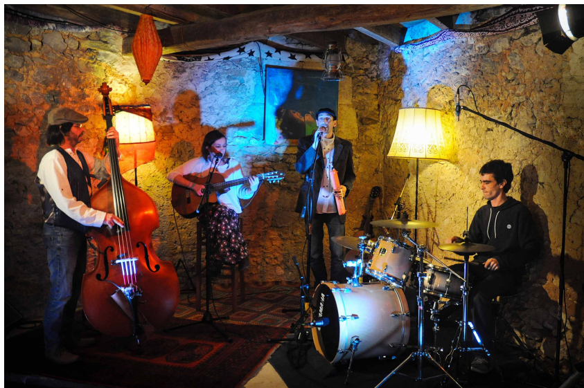
Teaser Macha Chansons Françaises